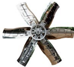
ใบพัดสแตนเลส 430