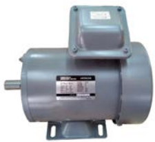
ประกอบด้วยมอเตอร์ฮิตาชิ